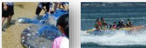
家族ぐるみで夏を満喫