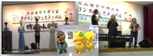
従業員とその家族参加による恒例の年度末イベントを開催