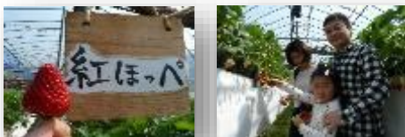
家族と一緒にイチゴ狩り