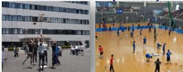
従業員の健康促進（体力づくり）と職場のコミュニケーション向上