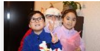
従業員宅にサンタさん訪問