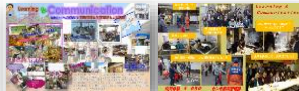
職場単位で年2回集まりコミュニケーション向上