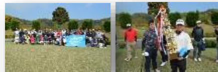
従業員のコミュニケーション向上