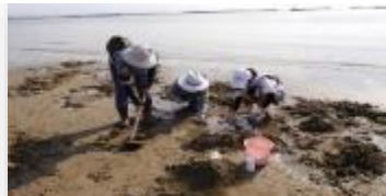
従業員家族によるマテ貝採取