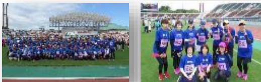
従業員健康促進（体力づくり）